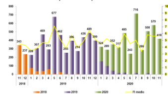
Factor de Impacto IiSGM por mes de indexación