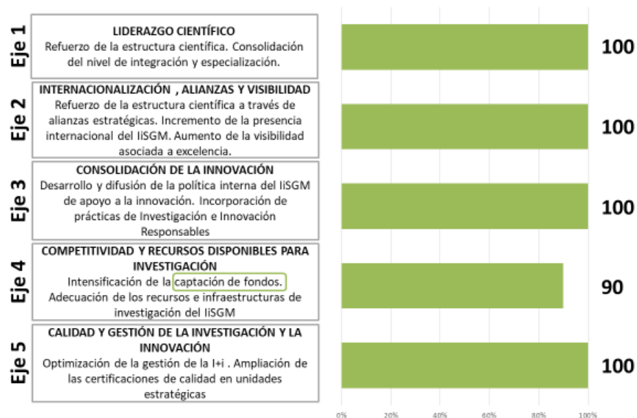
Plan Estratégico: Grado (%) de cumplimiento Plan Acción 2021

El nuevo plan estratégico 2022-2026 establece 4 Objetivos estratégicos, resultado del análisis